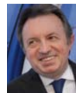
JEAN-NOËL GUÉRINI Président du Conseil général des Bouches-du-Rhône Sénateur Vice-Président d'Euroméditerranée

« L'aménagement de l'entrée de ville va d'abord rendre des espaces publics requalifiés aux habitants, condition nécessaire à l'émergence d'un véritable quartier de la Porte d'Aix. A l'occasion d'une opération d'infrastructures, la Communauté urbaine crée les conditions nécessaires au développement des transports en commun en facilitant leur accessibilité à partir de l'A7 et en développant un site propre sur le boulevard Leclerc. En cohérence avec 2013 et un centre-ville apaisé et attractif, la circulation automobile sera réduite, tout en assurant la desserte locale et le développement des modes doux, avec en particulier une zone cyclable en continuité sur l'ensemble de l'aménagement. »