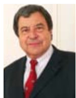
MICHEL SAPPIN Préfet de la Région Provence-Alpes-Côte d'Azur Préfet de la zone de défense sud Préfet des Bouches-du-Rhône

« Depuis plusieurs années Euroméditerranée a engagé une vaste opération de rénovation des quartiers Saint-Charles - Porte d'Aix. Actuellement des travaux sont en cours concernant la transformation et le réaménagement de l'entrée dans Marseille. Ce chantier marque une étape décisive dans la reconquête d'une des entrées principales de la ville de Marseille et apporte une nouvelle impulsion au projet d'intérêt national Euroméditerranée dans ce quartier historique. D'autres aménagements y ont d'ailleurs été lancés et de nouveaux projets suivront. C'est le signe tangible du renouveau et de l'élan de Marseille. »