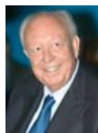
JEAN-CLAUDE GAUDIN Maire de Marseille Vice-Président du Sénat

« Depuis plusieurs années Euroméditerranée a engagé une vaste opération de rénovation des quartiers Saint-Charles - Porte d'Aix. Actuellement des travaux sont en cours concernant la transformation et le réaménagement de l'entrée dans Marseille. Ce chantier marque une étape décisive dans la reconquête d'une des entrées principales de la ville de Marseille et apporte une nouvelle impulsion au projet d'intérêt national Euroméditerranée dans ce quartier historique. D'autres aménagements y ont d'ailleurs été lancés et de nouveaux projets suivront. C'est le signe tangible du renouveau et de l'élan de Marseille. »