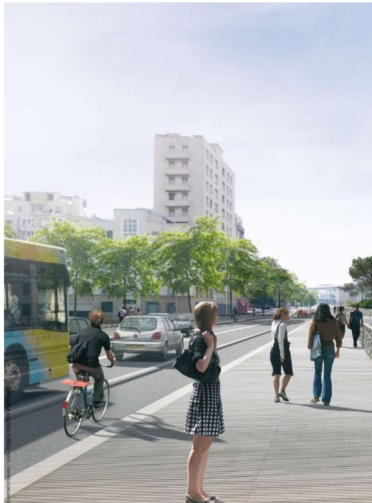
© EUROMÉDITERRANÉE / SEURA. Image à caractère d'ambiance