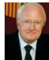
MICHEL VAUZELLE Président du Conseil Régional Provence-Alpes-Côte d'Azur Député des Bouches-du-Rhône

« Au-delà du symbole fort marquant une nouvelle entrée de ville, le remodelage de l'A7 est une formidable occasion pour les habitants de se réapproprier cet espace qui, je le souhaite, offrira un cadre de vie apaisé avec équipements publics et espaces verts, et répondra aux grandes ambitions de Marseille. Des projets de transports collectifs aux aménagements de voirie, du logement à la rénovation urbaine, le Conseil général s'est résolument engagé à accompagner ces changements. »