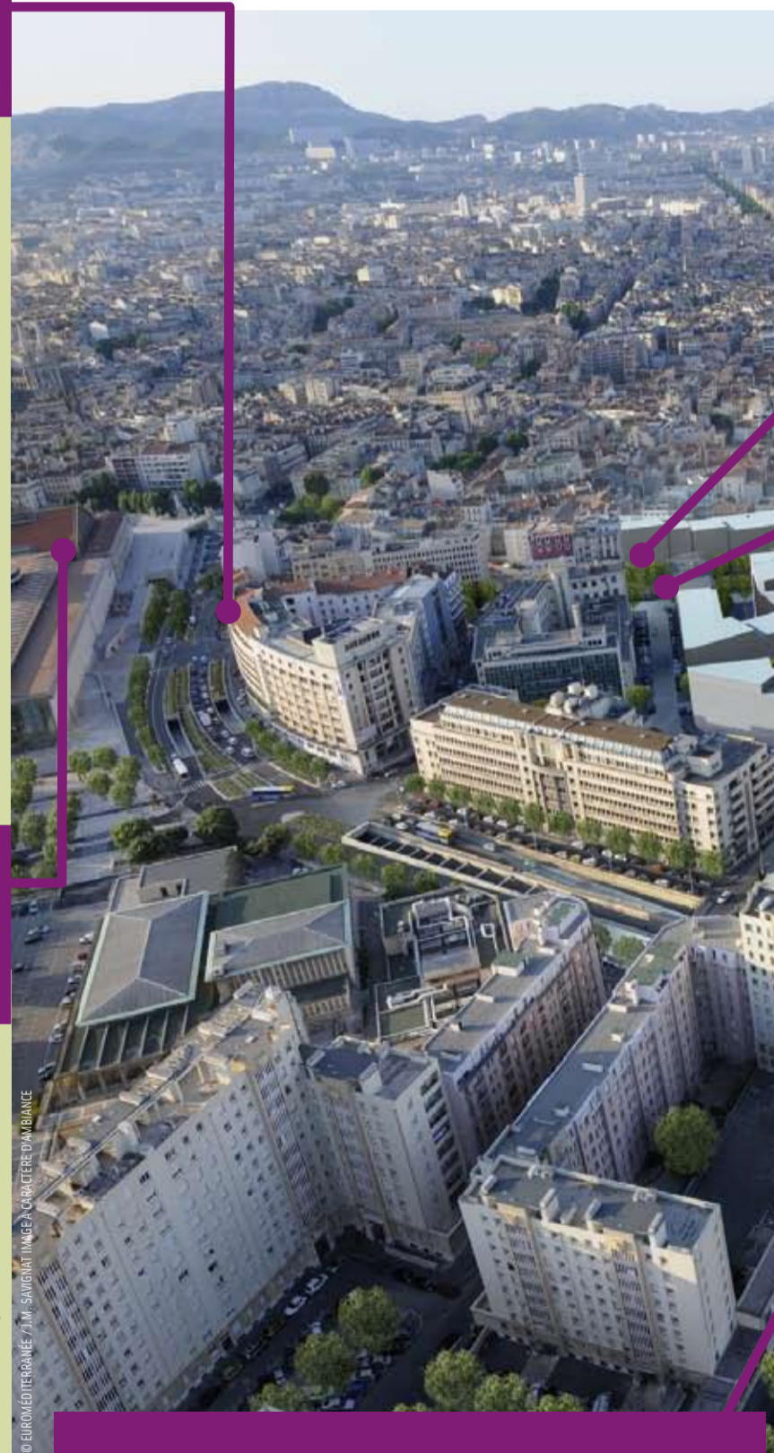
Vue aérienne du futur quartier Saint Charles - Porte d'Aix

L'immense halle Honorat domine désormais de sa géométrie de verre le quartier Saint-Charles. Si le premier regard et le premier pas dans une gare comptent dans la réussite d'un séjour, alors la transparence lumineuse du pôle de transports est de bon augure pour des millions de visiteurs chaque année. Inaugurée en décembre 2007, l'année d'un cap franchi (15 millions de passagers !), la gare s'est ensuite habillée d'espaces publics de qualité, déployés sur les 2,2 hectares de son parvis et de la place Victor-Hugo : près de 120 arbres plantés, une centaine de candélabres, des espaces de repos, cinq points d'eau ornementaux, la création d'un cheminement piétonnier entre la gare et le campus Saint-Charles, des trottoirs élargis de 5 m, des pistes cyclables... Au total, près de 200 millions d'euros investis pour un vrai progrès dans la qualité de vie des habitants du quartier et des étudiants, doublé d'un vrai confort dans l'usage des transports proposés au sein du pôle. Trains, bus interurbains, navettes départementales, métros, taxis, vélos : pour les touristes comme pour les voyageurs du quotidien, l'offre est plus lisible, plus fluide, plus interconnectée... ♦